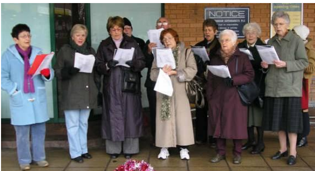
Cymdeithas Gymraeg Rhiwbeina yn canu carolau i chwyddo cronfa ei helusen am y flwyddyn sef Apêl Arch Noa - Ysbyty Plant Cymru

Os oes gan unrhyw un ddi-ddordeb mewn chwarae i un o'r timau, helpu'r clwb neu ddod i'r cinio dathlu, cysylltwch â'r Ysgrifennydd, Rhys Meilir Davies, rhysmeilir@hotmail.co.uk , ffôn 07775 992 673.