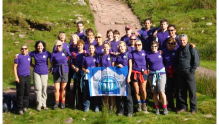
Ysgol Gyfun Bro Morgannwg yn cyflawni Her y Tri Chopa