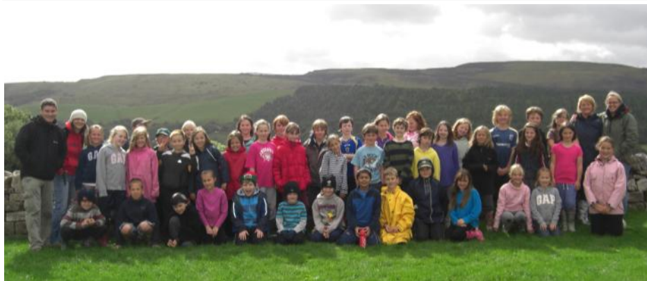
Disgyblion Blwyddyn 5 Ysgol y Berllan Deg ar Fferm Maes y Fron, Abercraf