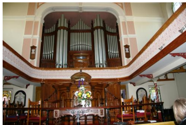
Organ Capel Tabernacl yr Ais (stori tudalen 11)