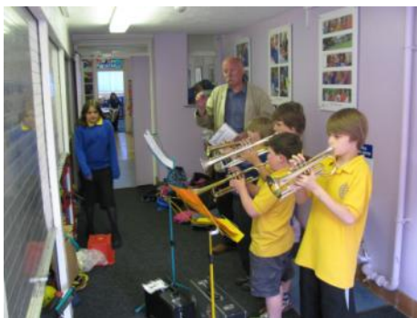
Yr un coridor fel ystafell gerdd