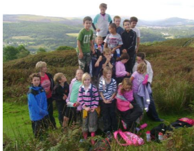
Ysgol Melin Gruffydd ar antur yn Abercraf