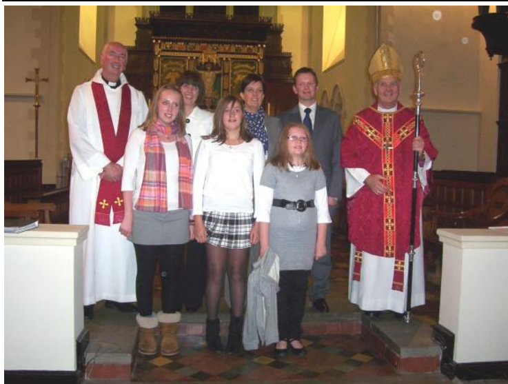
Archesgob Cymru a ficer Eglwys Dewi Sant gyda'r ymgeiswyr am Fedydd Esgob