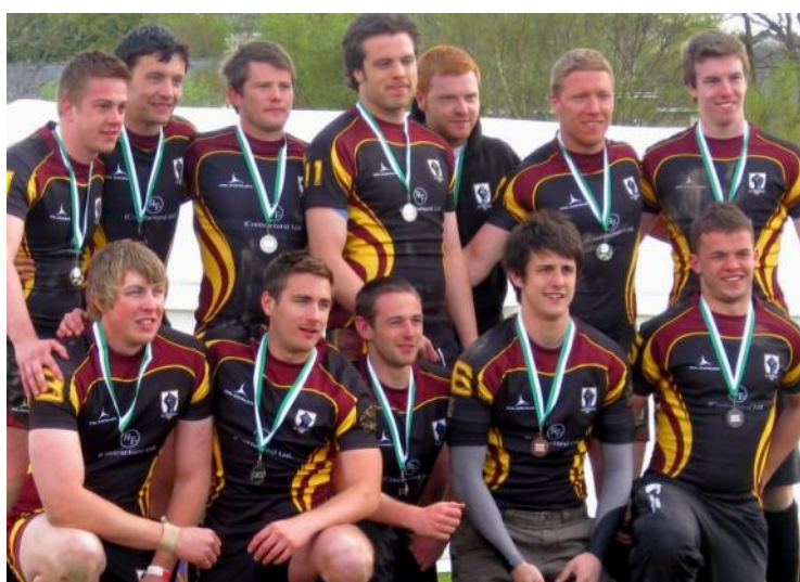
Meibion Plas Mawr (stori tudalen 14)