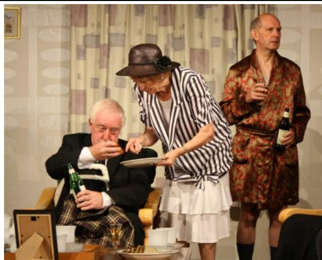
Thear y Crwys yng nghanol y ddrama gomedi (gweler tudalen 1)

Mae hefyd yn bosib gwneud apwyntiad i weld milfeddyg neu nyrs trwy gyfrwng y Gymraeg.