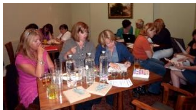
Aelodau Clwb Gwawr Caerdydd yn ceisio dyfalu blas gwahanol fwydydd a diodydd

Cafodd Clwb Gwawr Caerdydd gychwyn bywiog iawn i'r tymor eleni gyda'r noson agoriadol ym mis Medi. Roedd y noson yn Nhafarn y Cricketters Heol y Gadeirlan, Caerdydd yn gyfle i gyfarfod ag aelodau newydd a chymdeithasu drwy amrywiol weithgareddau. Roedd 'na gwis lluniau, cwis cerddoriaeth, sudoku a chyfle i adnabod blas siocled, creision a dŵr heb son am geisio gosod hoelion i gydbwysu ar un hoelen - tasg a lwyddodd i herio'r aelodau!!! Mae rhaglen y flwyddyn yn edrych yn amrywiol - o wneud gemwaith i ddawnsio a chreu sushi, i helpa drysor, bbq a thaith siopa. Am fanylion cysylltwch â clwbgwawrcaerdydd@hotmail.com neu ein tudalen Facebook: clwbgwawrcaerdydd neu Twitter clwbgwawrcdydd.