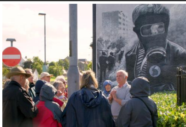
Cyfeillion Carnhuanawc yn edmygu murlun