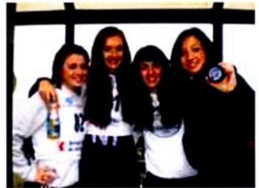
Merched sgio Glantaf