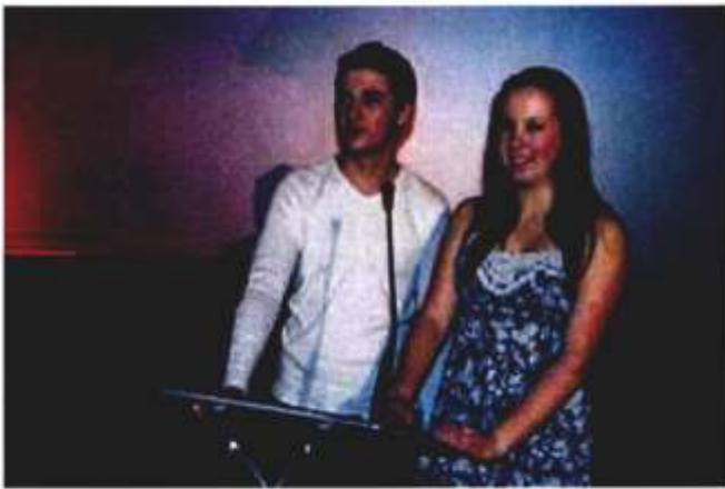
Glantaf Cyflwyno Gwobrau Media4Schools