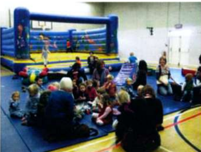
Cylch Meithrin Treganna