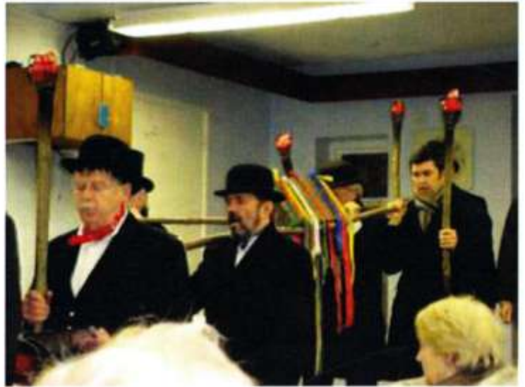
Merched y Wawr Bro Radur