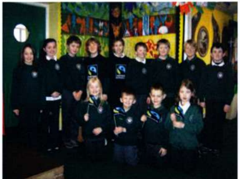
Ysgol y Wern