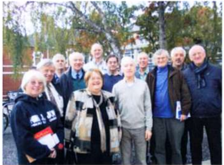
Aelodau Cymdeithas Hanes y Blaid

Disgyblion Plasmawr ar eu diwrnod olaf o'r alldaith yn Eryri 2010. Yn Neuadd y ddinas mis diwethaf plaser oedd gweld dros 70 o ddisgyblion Ysgol Gyfun Gymraeg Plasmawr yn cael eu cydnabod am eu llwyddiant ardderchog wrth gyflawni gwobr Dug Caeredin. Braff yw gweld bod y wobwr yn mynd o nerth i nerth ac yn tyfu'n flynyddol. Llongyfarchiadau mawr i chi gyd.