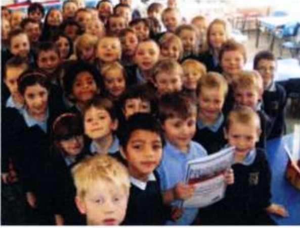
Ysgol Melin Gruffydd