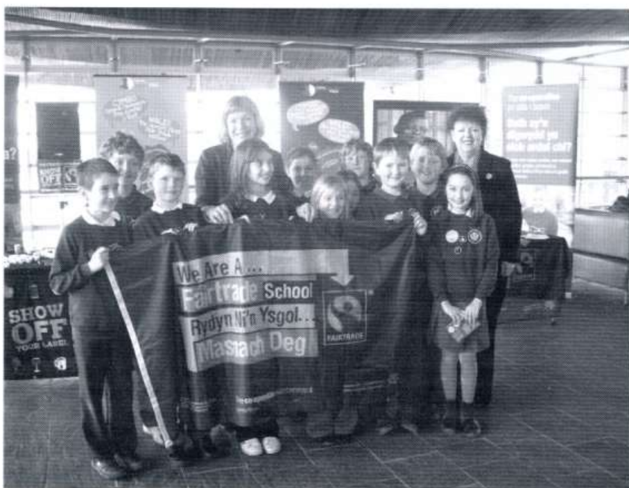
Ysgol y Wern - Masnach Deg

Rhagor o wybodaeth ar - www.fairtradewales.com