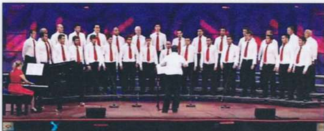
A' ni 'ma 'to