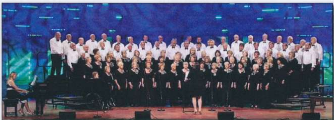
Côr y Mochyn Du