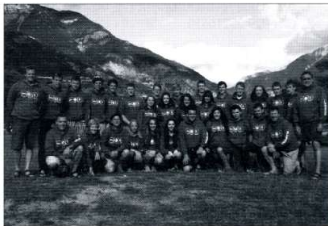
Ymgeiswyr Gwobr Dug Caeredin Ysgol Plasmawr