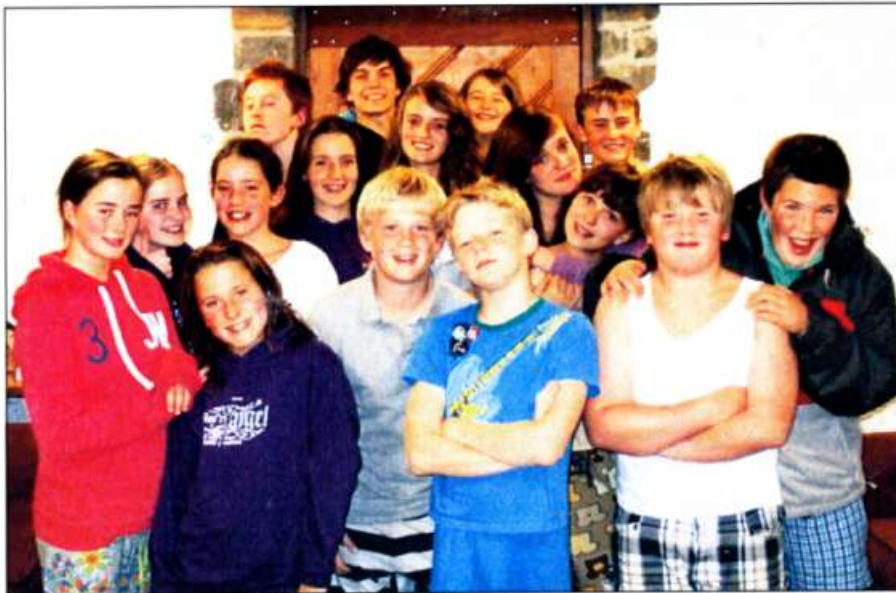
Criw bywiog PIMS (Pobl Ifanc Minny Street) yn cael hwyl yng Ngholeg Iwerydd, Sain Dunwyd