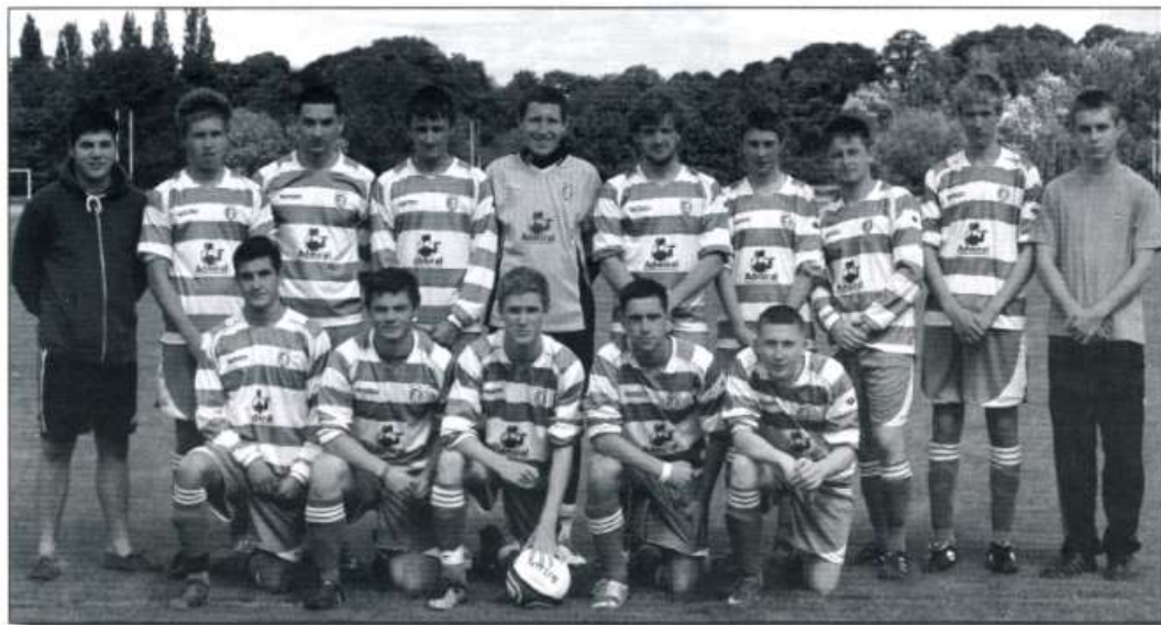
Clwb Cymric (Clwb Pêl-droed Cymry Caerdydd)