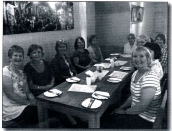
Aelodau o Ferched y Wawr Caerdydd yn disgwyl am eu te prynhawn yn Nhy Te Waterloo yn Mhenlan ar ddiwedd blwyddyn lwyddianus arall i'r gangen