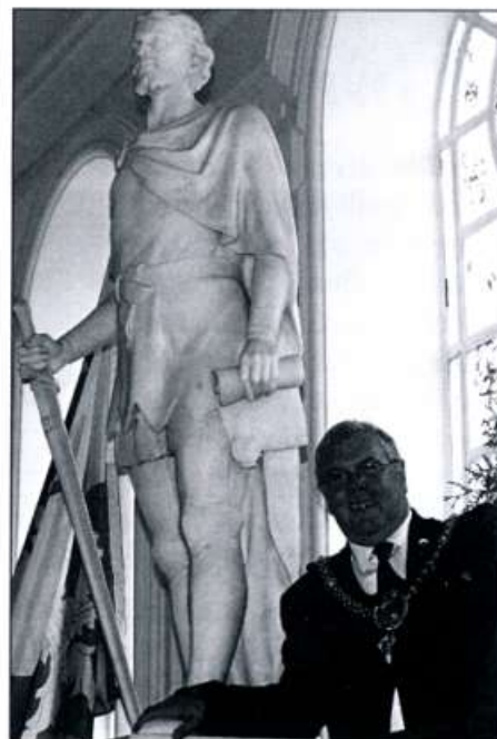
Yr Arglwydd Faer a cherflun Owain Glyndŵr