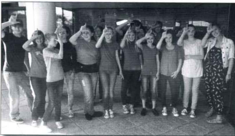
Criw Clwb Glee Menter Caerdydd ar Gwrs dau ddiwrnod a pherfformiad llwyddiannus yn y Lanfa

Croeso cynnes i blant 4-12 oed sy'n mynychu addysg Gymraeg. Does dim angen cofrestru o flaen llaw, dim ond dod ar y diwrnod! Mae'r sesiynau yn rhad ac am ddim.