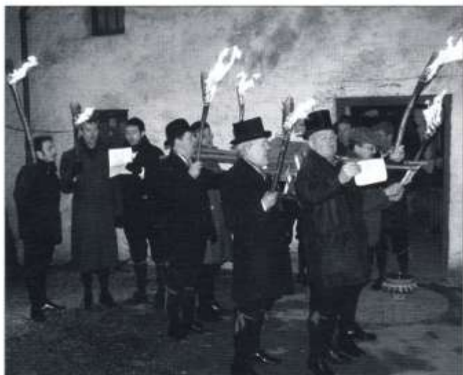
Aelodau o Gwmni Dawns Werin Caerdydd yn perfformio'r ddefod o Hela'r Dryw

Diolch yn fawr i bawb a ddaeth i'r noson ac am gyfrannu mor hael.