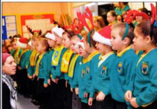
Y stori'n llawn ar dudalen 8