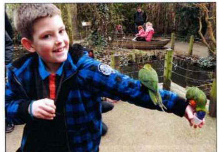
Un o blant Bwrlwm Ysgol y Berllan Deg yn rhoi bwyd i'r parots yn Sŵ Bryste