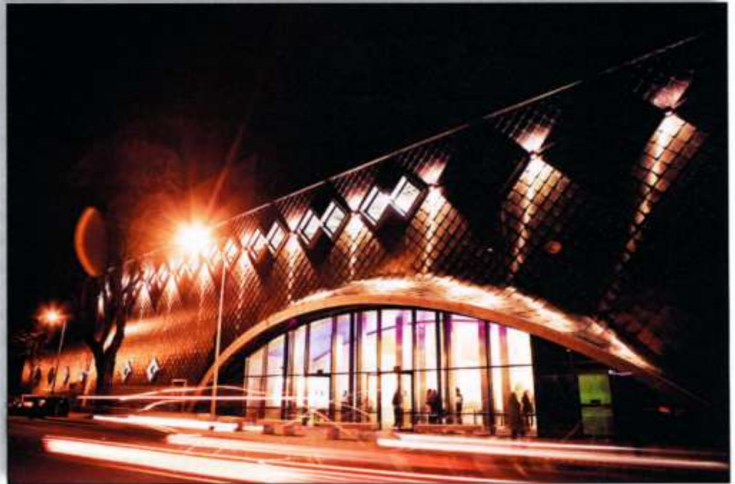
Y Sherman ar ei newydd wedd

Ffurfiwyd Cwmni Sherman Cymru bum mlynedd yn