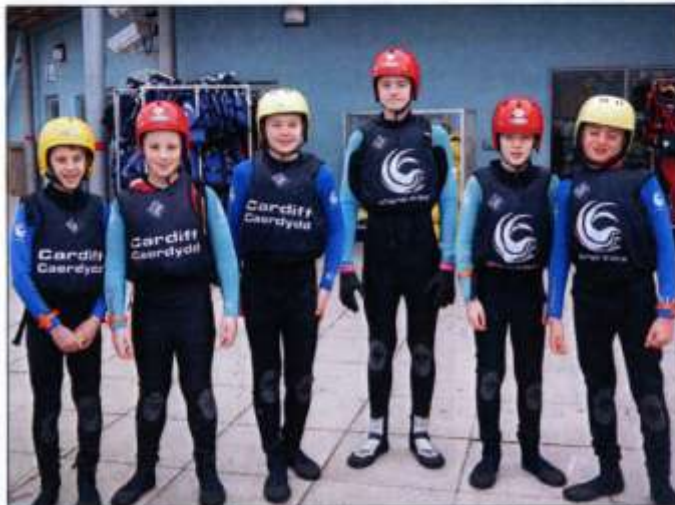
Crïw o ddisgyblion Plasmawr a Glantaf yn barod i rafftio dwr gwyn lawr yn y Bae yn ystod hanner tymor