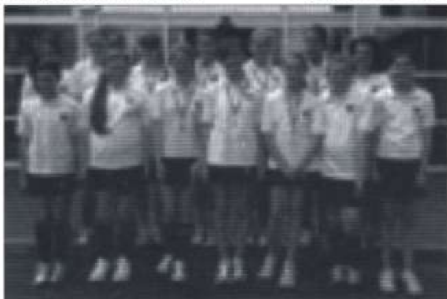
Tîm Pêl-rwyd Buddugol Plasmawr