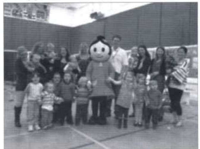
Sali Mali gyda phlant a rhieni'r Cylch

Rhwng y chwarae, y canu, yr amser stori a'r byrbryd iachus i'r plant - heb anghofio'r cyfle am banded a chlonec i'r oedolion wrth gwrs - cafwyd cryn dipyn o hwyl gan bawb. Un o uchafbwyntiau'r bore oedd ymweliad arbennig gan neb llai na Sali Mali!