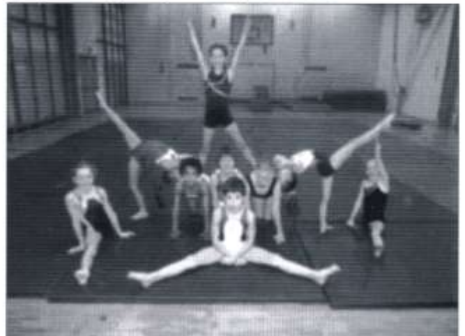
Tîm gymnasteg buddugol yr ysgol

Llwyddodd y tîm gymnasteg i gipio'r wobwr gyntaf yng nghystadleuaeth gymnasteg Cymru ac felly byddant yn cynrychioli Cymru yn Stoke ym mis Mai.