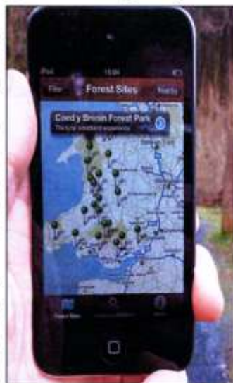
App newydd y goedwig yn dod â byd o hwyl awyr agored at flaenau bysedd pobl.