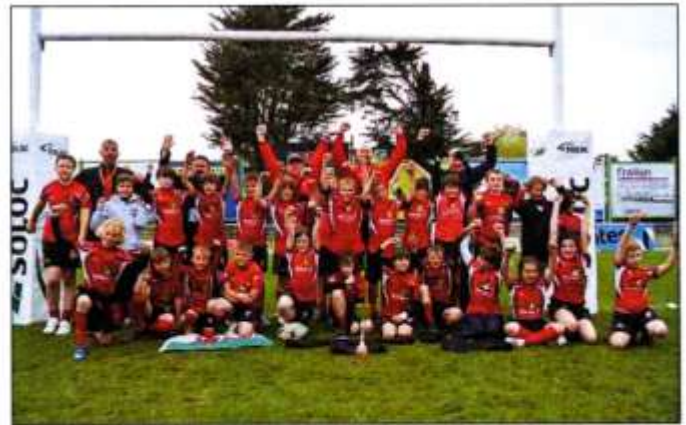
Yr holl chwaraewyr, yr hyfforddwy a'r cwpan

Tîm dan 11 ddechreuodd y gystadleuaeth, ond yn anffodus colli'r gêm gyntaf o 1 cais i ddim oedd eu hanes yn y diwedd. Cafwyd buddugoliaeth yn erbyn y ddau wrthwynebydd nesaf ond, yn anffodus, nid oedd yn ddigon i gyrraedd y rowndiau terfynol. Cafwyd un perfformiad displair arall, wrth i'r tîm