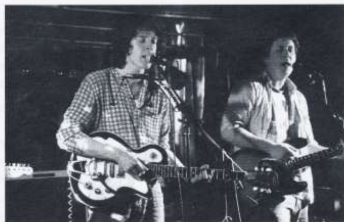
Cowbois Rhos Botwnnog yn perfformio yng Nglwb y Diwc.

Un o amcanion Clwb y Diwc yw hyrwyddo'r Gymraeg yn ardal Treganna a thu hwnt felly mae unrhyw elw yn cael ei ddsbarthu i fudiadau sy'n gwneud cais am arian. Ymhlith y rhai sydd wedi derbyn arian gan Glwb y Diwc yn ddiweddar mae Adran yr Urdd, Salem; gardd gymunedol Treganna yn Chapter; a band Melin Gruffydd.