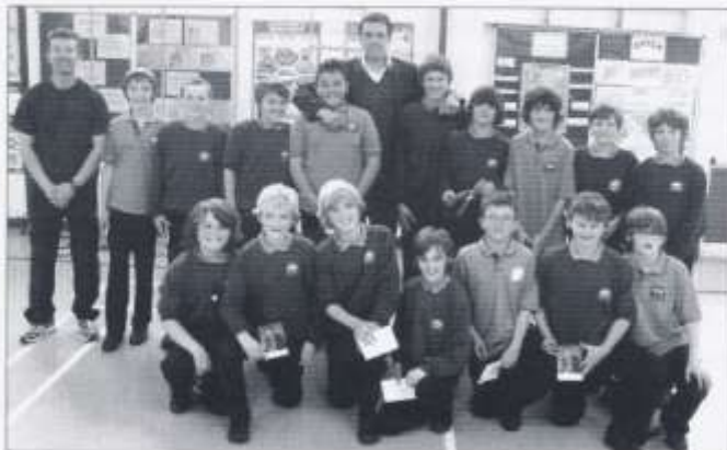
Chris a Tîm Bl.7

Ar ddydd Gwener, 27 Ebrill ymwelodd rheolwr tîm pêl-droed Cymru â'r Ysgol. Cynhaliwyd sesiwn cwestiwn ac ateb gyda Chris cyn iddo gael ei lun wedi tynnu gyda thîmau pêl-droed yr Ysgol. Mwynhaodd y plant onestrwydd a charisma Chris wrth iddo ateb eu cwestiynau ac roeddent yn teimlo mai anrhydedd oedd croesawi y fath ymwelydd.