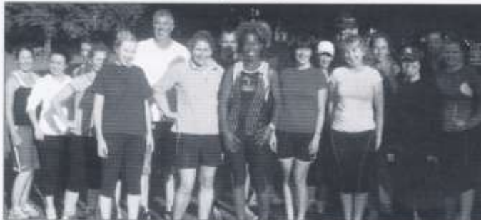
Aelodau brwd Bwt Camp, clwb ymarfer corff yng Nghaeau Pontcanna. Mae'r ychydig ddynion yn llechu yn y cefn. A oes rhywun yn adnabod wyneb cyfarwydd o blith y dynion? Clw – cyn-gamwr pop a chyflwynydd teledu a radio. Atebion ar gerdyn post i'r golygydd os gwelwch yn dda.