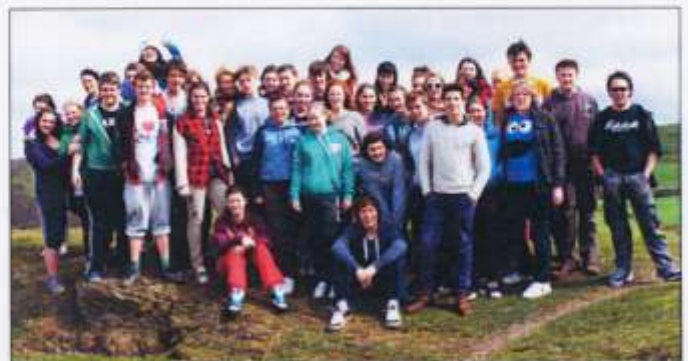
Cast 'Sneb yn Becso Dam yn Llangrannog

Bydd y ddrama'n ymweld â theatr Sherman Cymru ar 13 Gorffennaf.