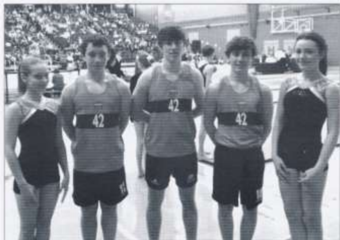
Tîm Llaur a Llofnedio

Fe wnaeth y tîm gystadlu yn frwd yn erbyn deuddeg