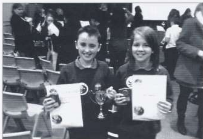
Brennig a Beth