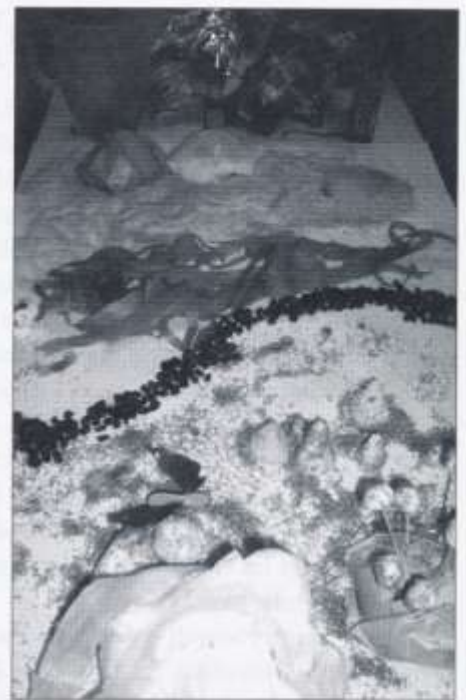
Dyma Ardd Eden wedi'i gwneud allan o losin – blasus iawn!!

Mae croeso i ragor o deuluoedd o bob eglwys ymuno. Cynhelir y cyfarfodydd nesaf ar 2 Mehefin a 14 Gorffennaf, rhwng 2:30 a 5:00.