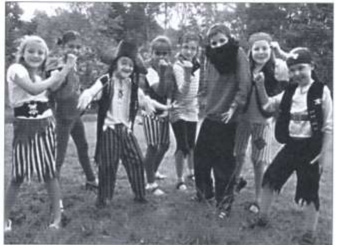
Tîm y Cwis Llyfrau