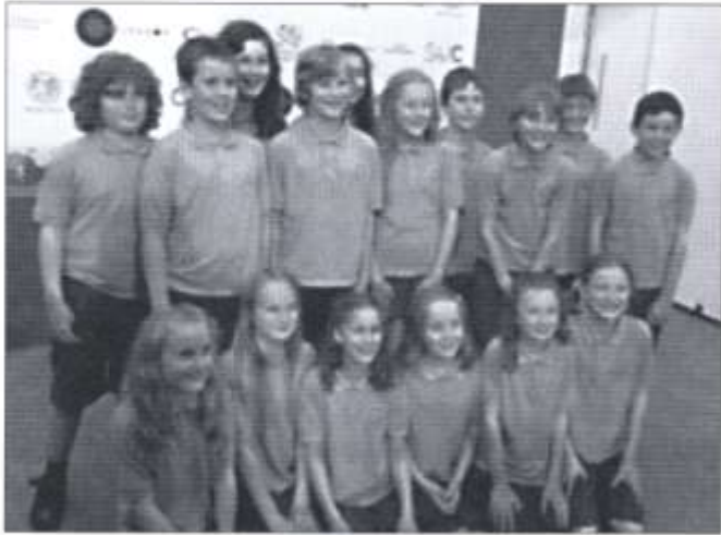
Y Parti Deulais

Llongyfarchiadau mawr iawn i Barti Deulais yr ysgol a lwyddodd i gyrraedd llwyfan yr Eisteddfod Genedlaethol a chipio'r drydedd wobr. Diolch yn fawr iawn i'r athrawon a'r plant am y gwaith caled a'r ymroddiad.