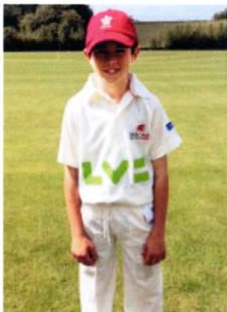
Tegid a'i gap cyntaf v. Swydd Gaerloyw