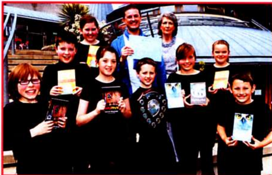
Disgyblion o Ysgol Sant Curig, y Barri, yn ennill Tarian Dr Dewi Davies yn y gystadleuaeth ar gyfer Blynnyddoedd 5 a 6.