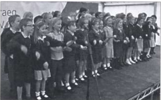
Côr Bach Tafwyl

Cafwyd prynhawn hyfryd yn y Tafwyl eleni a'r Côr Bach o ddisgyblion blynyddoedd 2 a 3 yn perfformio cyfres o ganeuon. Cafwyd perfformiad hyfryd gennych ac roeddech i gyd yn edrych fel petasech chi wrth eich boddau ar lwyfan yr Ŵyl. Diweddglo da i flwyddyn o waith caled! Da iawn chi!