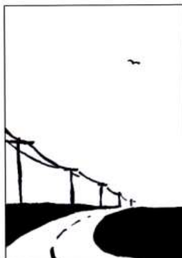
Enghraifft o waith Huw Aaron