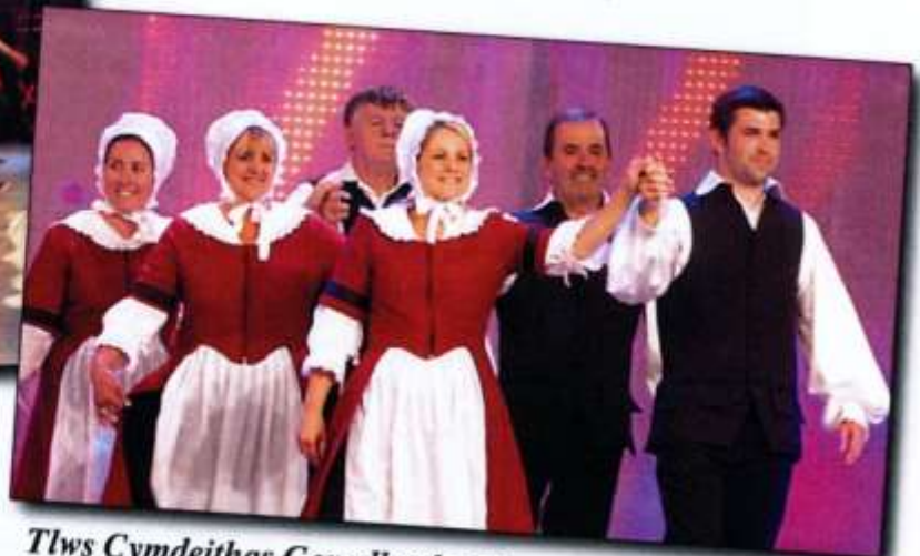
Tlws Cymdeithas Genedlaethol Dawns Werin Cymru (90) 1. Cwmni Dawns Werin Caerdydd