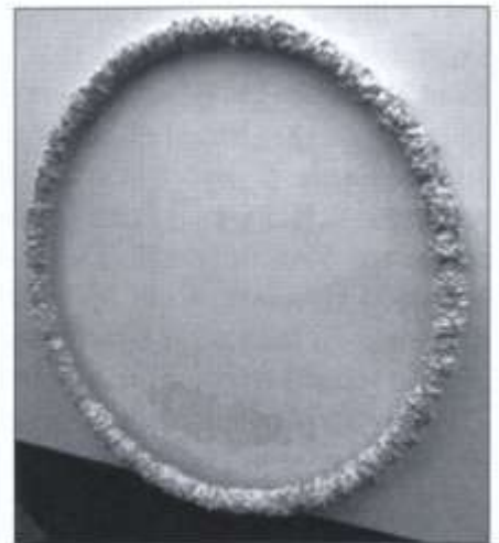
Cast yw enw'r gwaith yma gan Carwyn Evans wedi ei wneud o china asgwrn a haearn

Er bod yr artist wedi ymgartrefu yng Nghaerdydd bellach, mae ei gynefin yn Llandyfriog, Ceredigion, yn ysbrydoliaeth barhaol iddo.