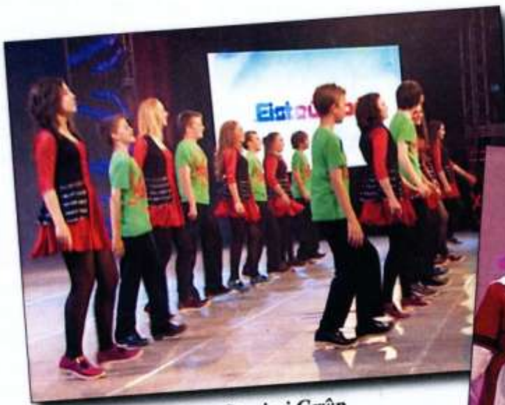
Dawns Stepio i Grŵp 1. Bro Taf (Pontypridd)