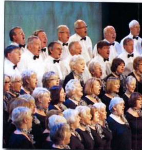
Côr Pensiynwyr dros 60 oed Côr y Mochyn I