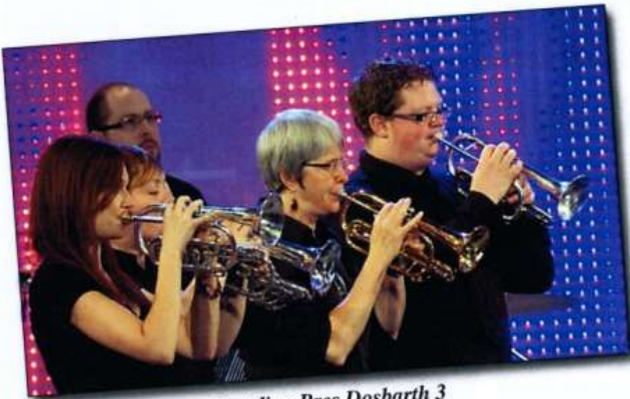
Bandiau Pres Dosbarth 3 Band Dinas Caerdydd Melingriffith (2)