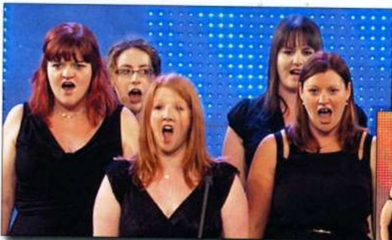
Côr hyd at 35 o leisiau Côr CFI