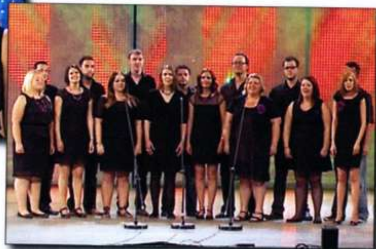
Parti Cerdd Dant hyd at 20 mewn nifer - Agored 1. Criw Caerdydd