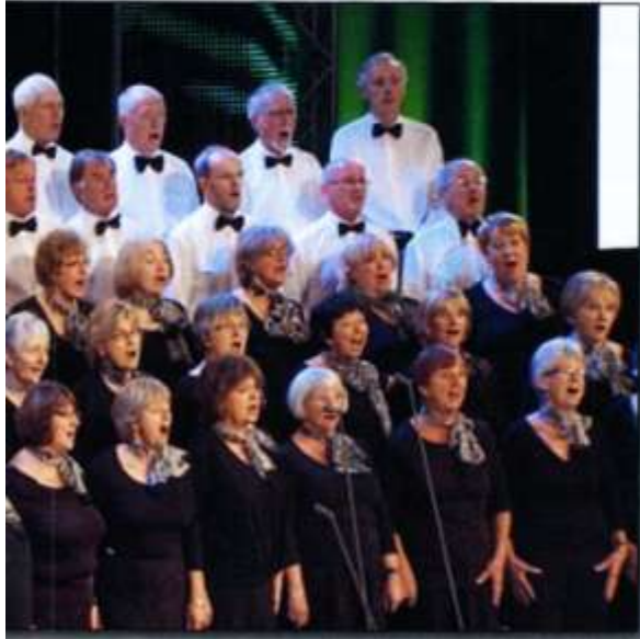
60 oed a dros 20 mewn nifer Chyn Du Caerdydd