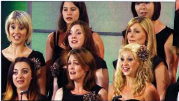
Côr Cymysg rhwng 20 a 45 mewn nifer 1. Cordydd