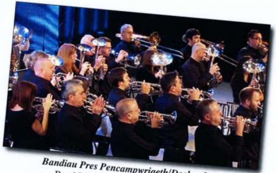
Bandiau Pres Pencampwriaeth/Dosbarth 1 Band Dinas Caerdydd (Melingriffith)