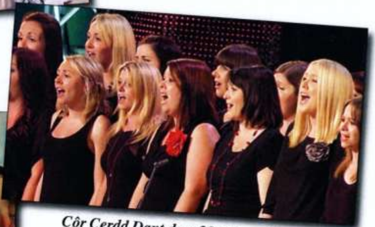
Côr Cerdd Dant dros 20 mewn nifer 1. Merched y Ddinas