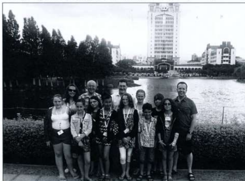
Y criw a aeth i Tsieina

Yr ymweliad nesaf oedd dinas Chongquin gyda phoblogaeth o 7 miliwn a'r rhan fwyaf o'r bobl yn