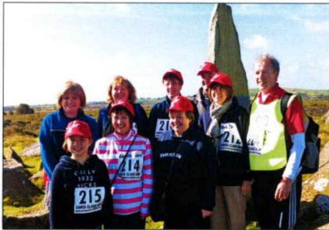
Huw gyda Phererinion wrth garreg coffa Waldo ger Mynachlogddu

"Roedd yr ymweliad â Ysgol Casmael, lle bu Waldo'n dysgu, yn llwyddiannus iawn a'r disgyblion wedi codi swm o £120 drwy hel ceiniogau yn defnyddio enw Waldo."