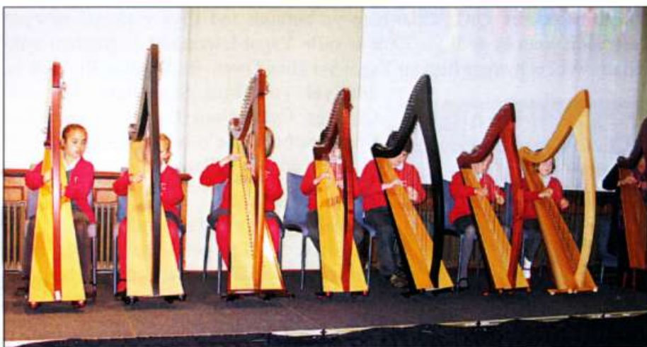
Côr Telynau Pwll Coch ym mharti 60 Rhieni Dros Addysg Gymraeg (gweler colofnydd y mis - tud 6)