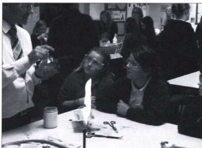
Gwyddonwyr y Dyfodol

Cynhaliwyd Noson Agored lwyddiannus ar Ddydd Mercher 17eg o Hydref gyda dros 300 o ymwelwyr yn ymweld â'r ysgol. Croesawyd rhieni, ffrindiau a darpar ddisgyblion a'u rhieni. Roedd cyfle i ymwelwyr fwynhau amrywiaeth eang o weithgareddau gan gynnwys arddangosfa gymnasteg, arbrofion gwyddoniaeth cyffrous, cyflwyniad dramatig a samplu rhai eitemau o'r lluniaeth sydd ar gael yn y siop goffi newydd.