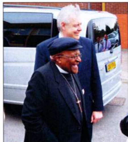
Yr Archesgob Desmond Tutu gyda'r Prif Weinidog, Carwyn Jones, yn Ysgol Plasmawr (gweler tud 8)

Mae'n amlwg fod cyfnod o drafod dwys o'n blaen. Nawr yw'r amser i addysgu ein hunain a mynegi barn. Am fanylion am amseroedd a lleoliadau cyfarfodydd trafod ac arddangosfeydd lleol ffoniwch 029 2087 3461 neu e-bostiwch LDP@cardiff.gov.uk