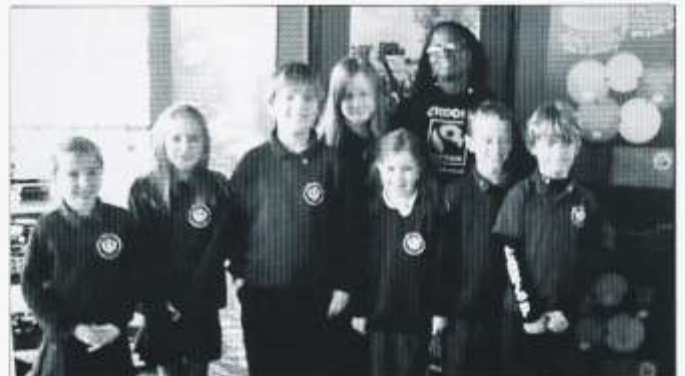
Rhai o'r disgyblion a fu yn lansiad Pythefnos Masnach Deg

Fel rhan o lansiad swyddogol Pythefnos Masnach Deg gwahoddwyd ein Pwyllgor Masnach Deg i berfformio yn y Cynulliad. Yn ogystal â hyn daeth ffermwraig o St Lucia i annerch ein disgyblion mewn gwasanaeth arbennig. Diddorol iawn oedd dysgu am daith y bananas o'i fferm hi i'n siopau ni.