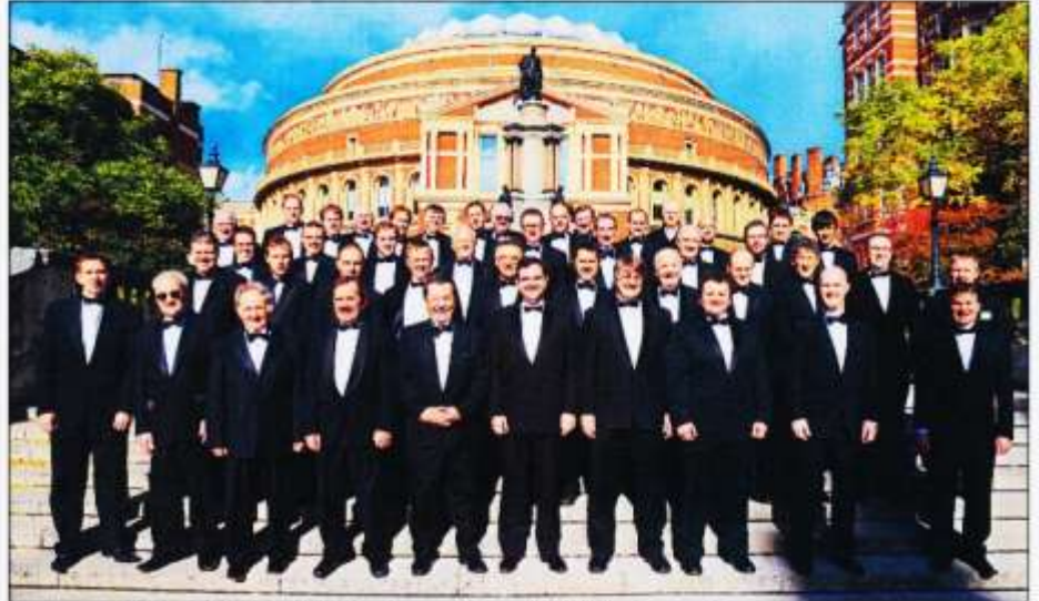
Côr Meibion Taf o flaen Neuadd Albert.