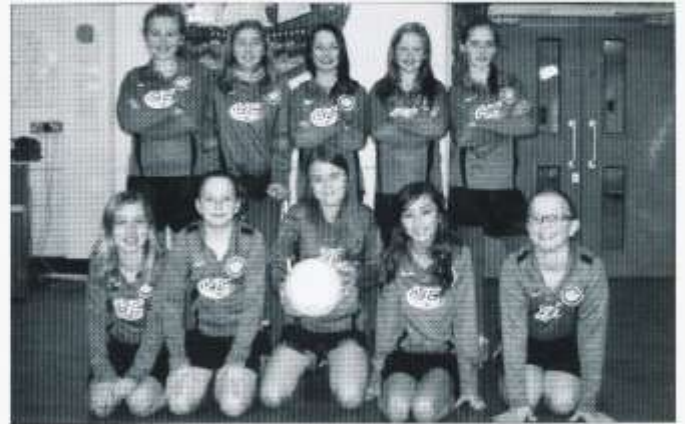
Tîm pêl-droed merched Y Wern

Llongyfarchiadau i'n tîm pêl-droed (merched) a ddaeth i'r brig yng Nghystadleuaeth yr Urdd Caerdydd a'r Fro ar ddechrau'r flwyddyn. Ar ôl atal pob gôl yn y gystadleuaeth cawsant eu coronni yn bencampwyr y dydd. Fe fyddant nawr yn cynrychioli'r Sir yn y Rownd Genedlaethol yn Aberystwyth. Pob hwyl i chi ferched.