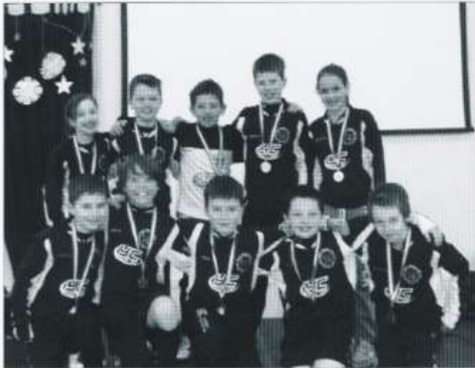
Tîm pêl-droed Y Berllan Deg

Llongyfarchiadau i'r tîm pêl-droed a ddaeth yn ail yn nhrnament pêl-droed yr Urdd yn ddiweddar (gweler y llun).