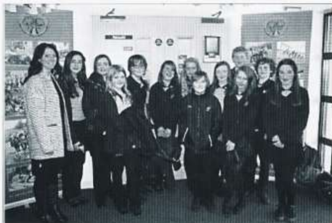
Disgyblion Bl 7 yn ymweld ag Ysgol y Berllan Deg ar Ddiwrnod y Llyfr