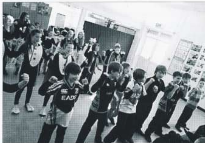
Disgyblion y Gân Actol