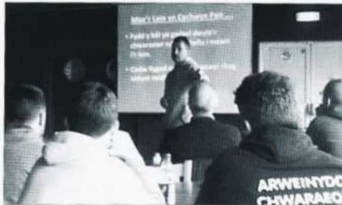
Nigel Owens yn cyflwyno cwrs Dyfarnu Rygbi Lefel URC fel rhan o raglen hyfforddiant y Fenter

Diolch yn fawr iawn i bawb sydd eisoes wedi llenwi ein holiadur diweddar am wasanaethau a gweithgareddau'r Fenter. Bwriad yr holiadur oedd monitro safon ac effeithlonrwydd ein gwasanaeth gan ein galluogi i fesur y galw am wasanaethau cyfrwng Cymraeg yn y dyfodol. Mae cyfle o hyd i chi ymateb a chyfrannu drwy lenwi'r arolwg ar ein gwefan, neu drwy ein cyfrif Facebook a Twitter. Bydd un holiadur lwcus yn ennill taleb i'w