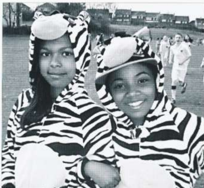
Hwylras CA3 Plasmawr