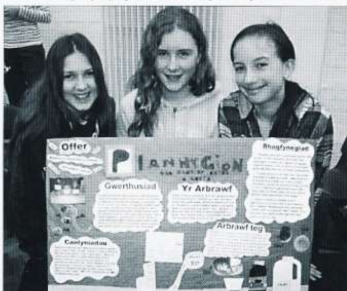
Ffair Wyddoniaeth Blwyddyn 7 Plasmawr