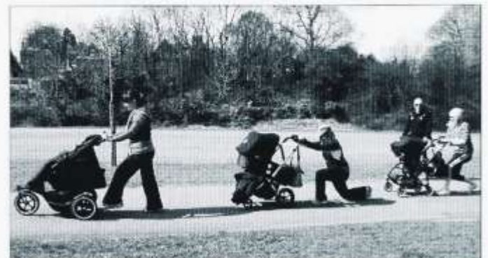
Dosbarth Bygi Heini newydd Menter Caerdydd sy'n cwrdd yn wythnosol ar Gaeau Llandaf

Cwrs diwrnod i gynorthwywyr dosbarth fydd yn canolbwyntio ar ddisgwyliadau yn y gweithle fel agweddau cadarnhaol, ymddygiad a sgiliau priodol. Darperir y cwrs gan Gwmni Hyfforddi Whitegate.