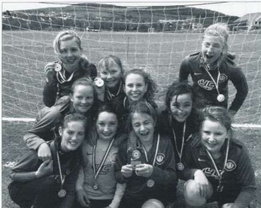
Tîm Pêl-droed y Merched

Fe fydd ein tîm Cwis Llyfrau yn teithio i Aberystwyth hefyd fis nesaf pan fyddant yn cystadlu yn Rownd Genedlaethol y Cwis Llyfrau. Llongyfarchiadau i blant Blwyddyn 6 a enillodd y rownd sirol eleni. Pob lwc i chi nawr yn Aberystwyth. Llongyfarchiadau hefyd i dîm Blwyddyn 4 a ddaeth yn drydydd yn y sir.