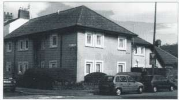
Y Jerwsalem a fu

Ar gornel Walker Road a Marion Street y safai Jerwsalem, capel y Presbyteriaid. Codwyd yr ysgoldy yn 1891 gyda Pembroke Terrace yn cwrdd â'r cyfan o'r gost o £500. Corfforwyd eglwys yn yr adeilad y flwyddyn ganlynol. Yn 1902 ychwanegwyd capel y festri ac mae'n amlwg fod yr achos yn un llewyrchus i ddechrau gyda'r cyfarfodydd agoriadol yn para pythefnos.