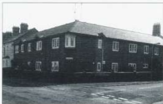
Y Bethlehem a fu

Mae'n sic eich bod yn synhwyro erbyn hyn mai capeli oedd Jerwsalem a Bethlehem hefyd ac fe brofodd y ddau yn fwy gwydn nac o safbwynt y Gymraeg.