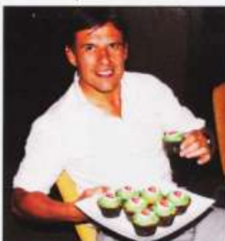
Chris Coleman yn mwynhau cacennau Clwb Cymric!