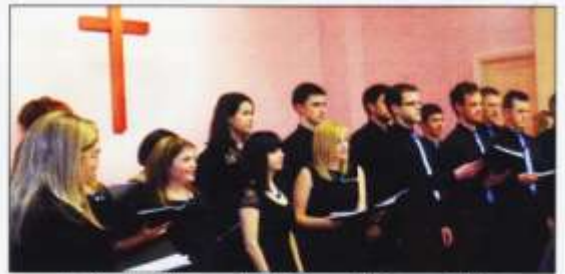
Aelwyd y Waun Ddyfal yng Nghymdeithas Gymraeg Rhiwbeina

eraill, yn byw yn y pentre gerddi. Bydd y daith yn cychwyn am 10:30 y bore, ddydd Mercher 3 Gorffennaf, o Lyfrgell Rhiwbeina. Mae croeso i'r di-Gymraeg. Lona Roberts