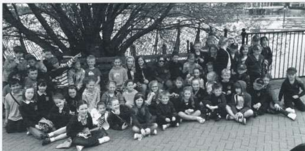
Blwyddyn 3 ar eu Cwrs Preswyl

Cafwyd llawer o hwyl yn ddiweddar pan aeth disgyblion Blwyddyn 3 i aros dros nos yng ngwersyll yr Urdd ym Mae Caerdydd. Llanwyd deuddydd llawn gyda gweithgareddau hwylus yn cynnwys trip cwch, bowlïo, helpa Fathemateg ac ymweliadau â'r Senedd a Techniquest . Rhaid canmol ymddygiad y plant, 'roedd yn bleser bod yn eich cwmni – da iawn chi!