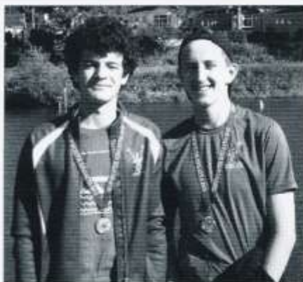
Garmon ab Ion a Guto John

Daeth llwyddiant i ran dau o fechgyn y brifddinas mewn cystadleuaeth rwyfo i barau ym Mynwy ddydd Sul Mai 26ain. Trechwyd Clwb Rhwyfo Dinas Abertawe yn y rownd gyntaf, Ysgol Gyfun Mynwy yn y rownd gynderfynol