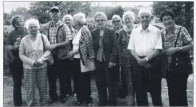
Rhai o aelodau Cymdeithas Gymraeg Rhiwbeina yn ymweld â bedd Michael D Jones ym mynwent Yr Hen Gapel, Llanowchllyn.

Yn ddiweddar bues i yng nghwmni aelodau o Gymdeithas Gymraeg Rhiwbeina am dair noson yn Llandudno. O'n i erioed wedi aros yna o'r blaen. Rhyfeddais at yr harddwch a'r diffyg sbwriel a graffiti.