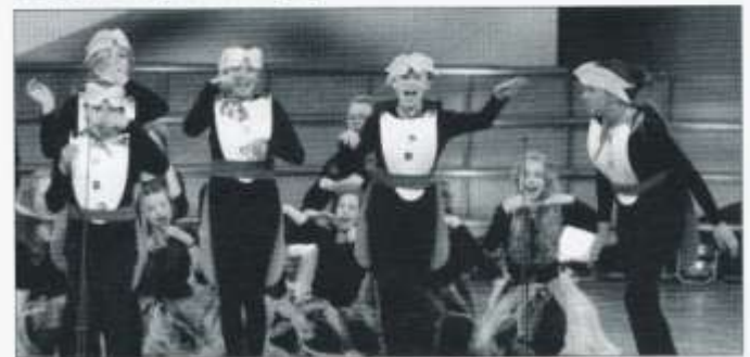
Y pengwinaid yn y Gân Actol

ddiddanu'r beirniaid a mynd ymlaen i'r llwyfan. Roedd pob un yn gyffrous wrth gwrs a phawb wrth eu boddau bod Bro Edern wedi cyrraedd y llwyfan ar yr ymgais gyntaf! Diwrnod arbennig iawn a dychwelodd pawb yn hapus gyda'r fedal efydd. Llongyfarchiadau mawr! Edrychwn ymlaen at y perfformiad nesaf.