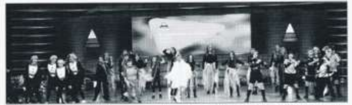
Dyma'r disgyblion yn perfformio'r Gân Actol ar lwyfan yr Eisteddfod