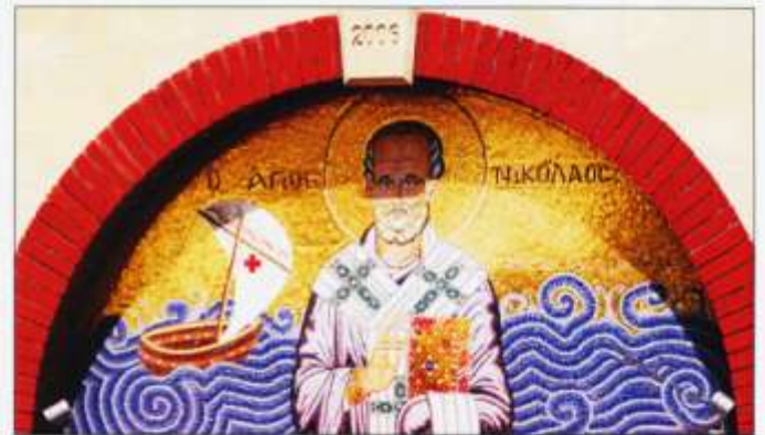
Mosaic y tu allan i Eglwys Sant Nicholas, yn disgrifio un o'r digwyddiadau yn ystod wythnos Tafwyl.

Yr ateb yw llong hwylio. Y sant yw Nicholas, yr eglwys yw'r Eglwys Unionged Groegaidd o Sant Nicholas yn Greek Church Street. Doedd dim llawer ohonom yn gwybod am ei bodolaeth tan y nos Fercher honno. Y llong yn ymddangos ar mosaic tu allan i'r eglwys. Roedd y naw cliw arall yr un mor rhwydd! Sgoriodd y timau rhwng 4 a 10, gyda dau dîm yn gyfartal, yn cyrraedd y llinell derfyn yn yr Yard ar yr un amser. Roedd pawb wedi dysgu llawer am ganol Caerdydd – ac wedi cael amser da. Diolch yn fawr Keith. I weld beth arall mae'r Cymdeithas yn ei wneud ewch at www.carnhuanawc.org