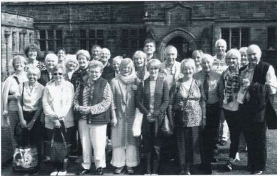
Aelodau Eglwys Dewi Sant o flaen eu cartref yn ystod y Bererindod - Llyfrgell Gladstone, Penarlâg