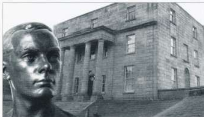
Padraig Pearse ac Amgueddfa Ysgol St Edna

Rhaid oedd ymweld â'r plasty bychan ar gyrion Dulyn