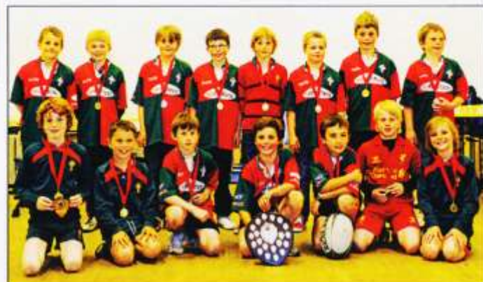
Carfan yr oedran ar noson wobrwyo ddiwedd tymor diwethaf.

Mae'r tymor wedi dechrau i'r deg oedran sy' nawr yn cynrychioli CRICC. Chwaraewyd gemau cyntaf gan mwyaf yn erbyn Rhiwbeina a Phenarth. Edrychwn ymlaen am fwy o lwyddiant yn ystod y tymor.