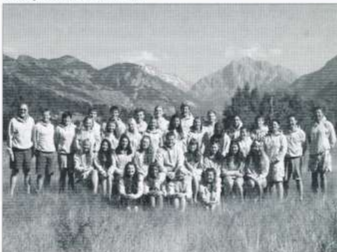
Criw yr alldaith

Pleser yw adrodd ar gyfres o ganlyniadau anhygoel i ddisgyblion Plasmawr eleni: