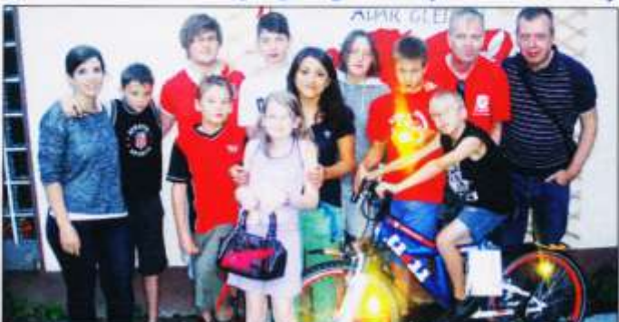
Plant yn Mainz yn mwynhau eu beic newydd