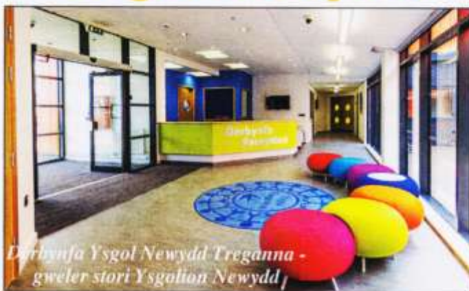
Dirbynfa Ysgol Newydd Treganna - gweler stori Ysgolion Newydd