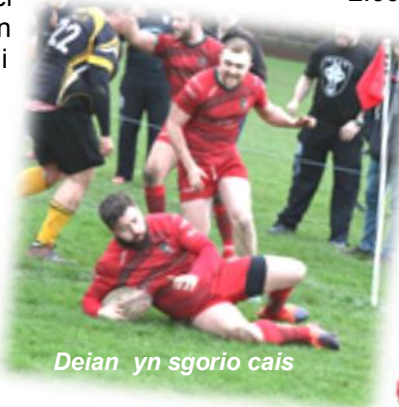
Deian yn sgorio cais

Cafwyd dechrau delfrydol gyda dau gais o fewn y deg munud cyntaf, ac er i Bendyrus wella sicrhodd penderfyniad y bechgyn ein bod ar y blaen ar hanner amser o 18 pwynt i 12. Bu rhaid amddiffyn yn gadarn yn yr ail hanner ond wedi cic gosb a chais pellach roedd y fuddugoliaeth yn ddiogel gyda 10 munud yn weddill. Coronwyd y fuddugoliaeth gyda