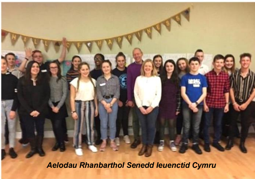
Aelodau Rhanbarthol Senedd Ieuenctid Cymru