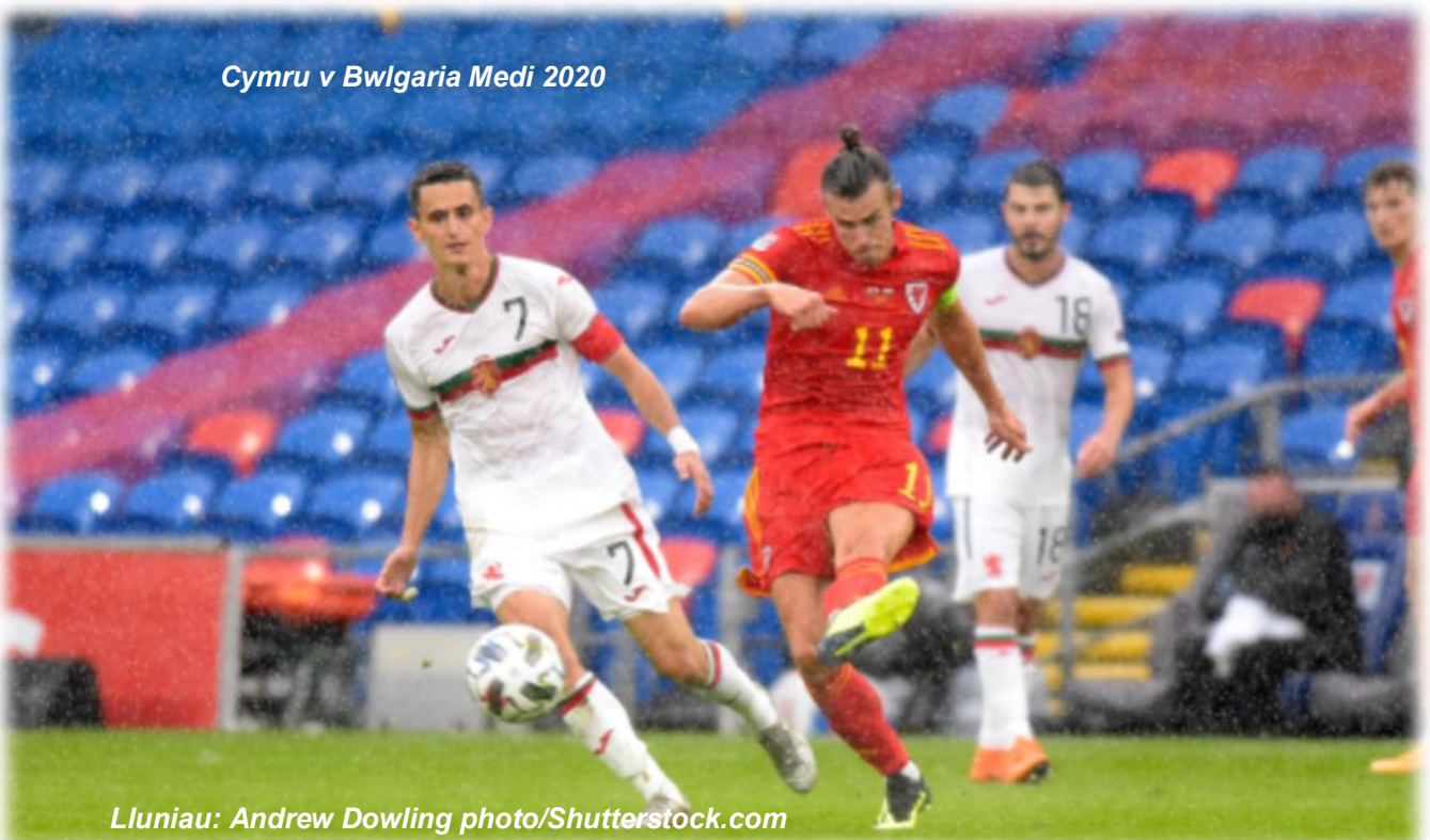
Cymru v Bwlgaria Medi 2020