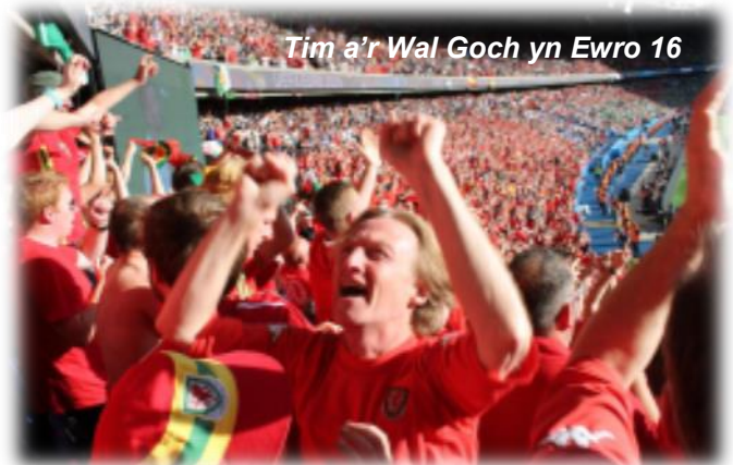
Tim a'r Wal Goch yn Ewro 16