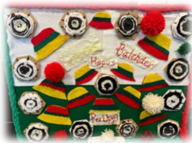
Gwaith Celf Adran Salem ar gyfer Eisteddfod yr Urdd

Mae'n hyfryd, hefyd, gweld Clwb y Bobl Ifanc yn parhau i gwrdd ar nos Wener unwaith y mis. Dymuniadau gorau i bawb sy'n sefyll arholiadau ar hyn o bryd.