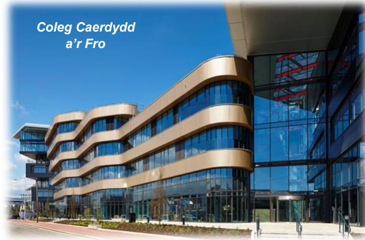
Coleg Caerdydd a'r Fro

Rydyn ni wedi gwirioni gallu cyhoeddi - ydy, mae'r Rhestr Testunau wedi'i chwblhau ac mae'n fyw ar wefan Cymdeithas Cerdd Dant Cymru. Ewch draw i gael cipolwg arni: Cymdeithas Cerdd Dant Cymru - Gŵyl Cerdd Dant (cerdd-dant.org). Mae'n llawn o ddarnau a syniadau gwych, yn ogystal â