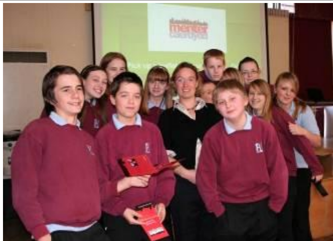
Rhai o ddisgyblion blwyddyn 9 Ysgol Radur ar un o gyrsiau ymwybyddiaeth iaith y Fenter